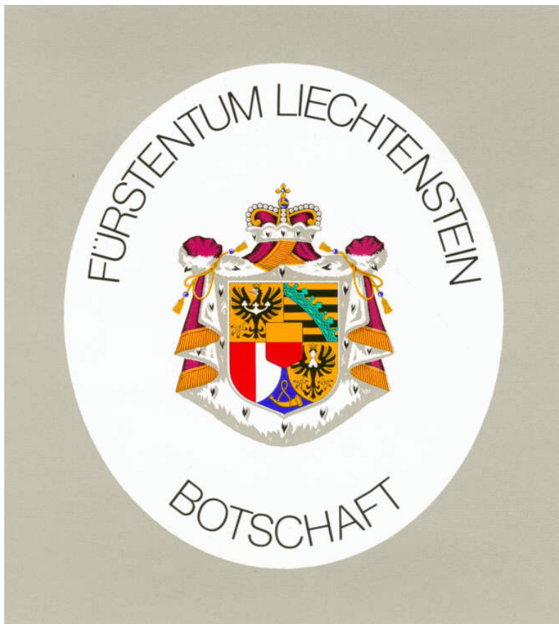
Abbildung Nr. 7

Ovales amtliches Schild (Art. 8 Abs. 2 und Abs. 3 Bst. b)