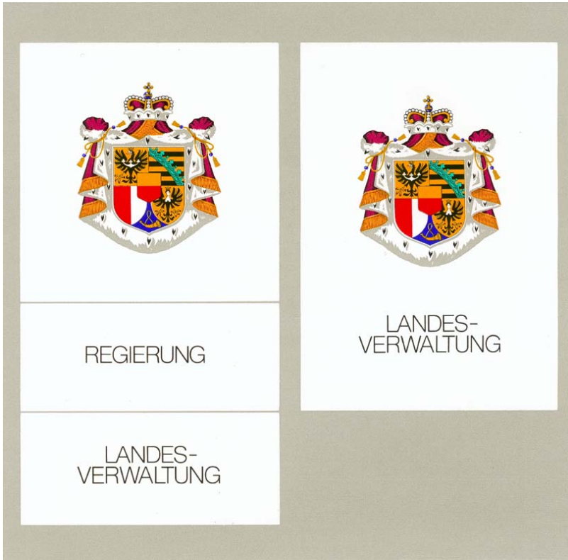
Abbildung Nr. 6