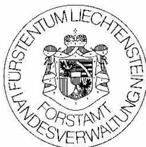
Abbildung Nr. 4 Siegel zu besonderen Zwecken (Art. 4)