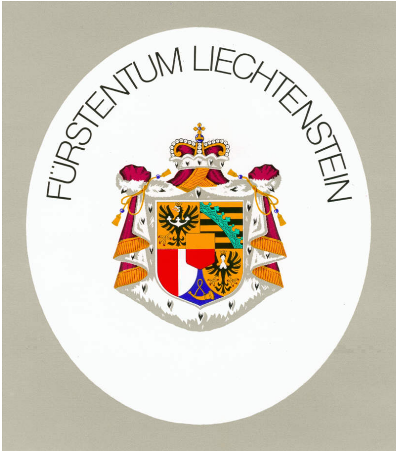
Abbildung Nr. 8