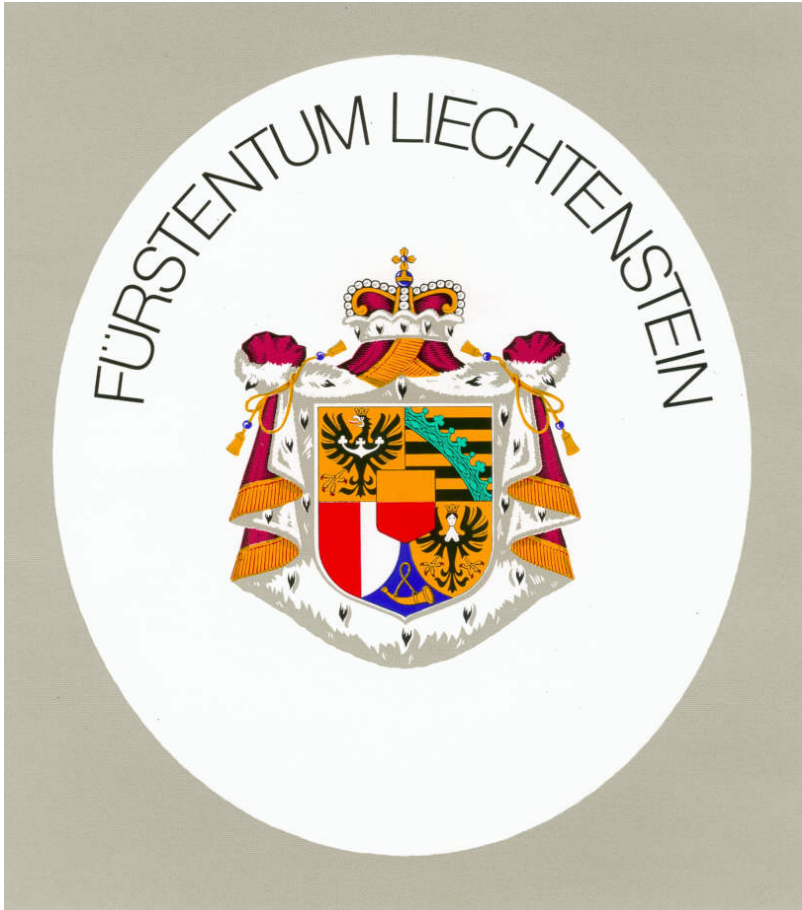
Abbildung Nr. 8